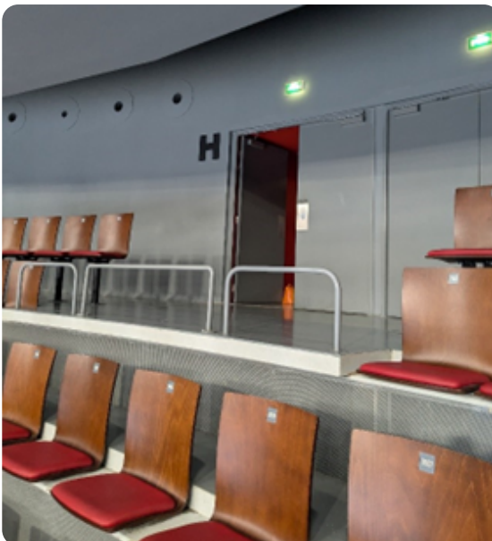
FIGURE 2 EXEMPLE D'EMPLACEMENTS EN COURONNE