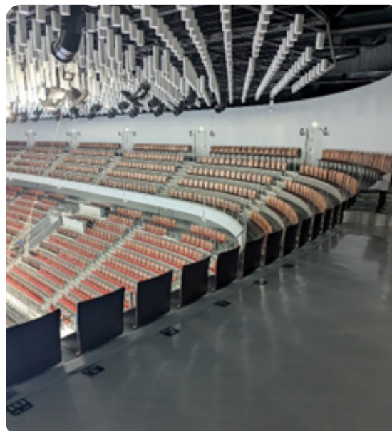
FIGURE 3 EXEMPLE D'EMPLACEMENTS AU BALCON